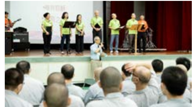
▲警光團契於北監佈道。

彼得前書 3:19-20 「祂藉這靈，曾去傳道給那些在監獄裡的靈聽，就是那從前在挪亞預備方舟，神容忍等待的時候，不信從的人，當時進入方舟，藉著水得救的不多，只有八個人。」