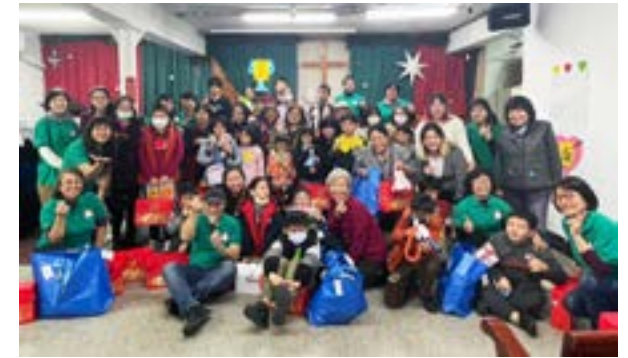
▲天使樹 2025 新春圍爐。