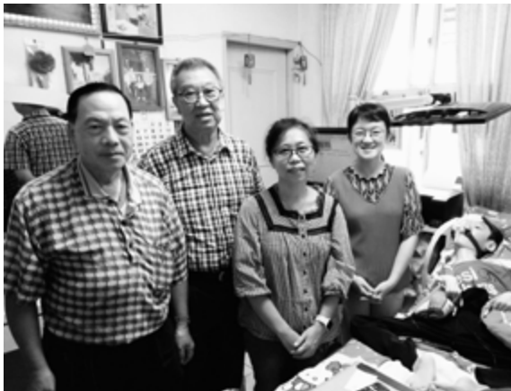
▲作者（右二）與採訪馨生人合照

對於被害人家屬來說，那深沉的痛好像永遠沒有盡頭，在幽暗的未來裡，日子一樣要過，路依然要走，但一切都不再一樣。看著電視新聞的我