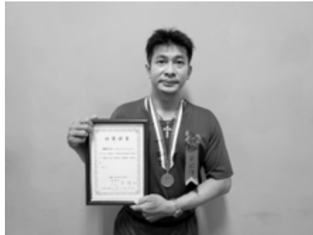
▲ 屏東區會第十六屆義光獎得獎人。

還有最重要的是『堅持』，你一定要堅持的改變，不要被一些生活的困難、挫折所打倒。我就是靠著堅持：堅持跟隨主的腳步，堅持禱告，堅持過教會生活，堅持學習對我有益處的事。我因著神賜給我的智慧、信心及勇氣，使我知道，在生活當中，我可以軟弱，但是我不可以墮落。上帝真的是一位又真又活的神，祂改變了我，讓我得著新的生命，也讓我確信我將來的生命會越來越美好。所有一切榮耀、讚美歸於神，阿們！