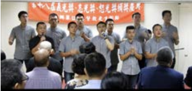
▲日光之家帶領敬拜讚美。

今年是團契43週年，也是一年一度『志光、義光、恕光』頒獎慶典，在9月27日長春禮拜堂舉