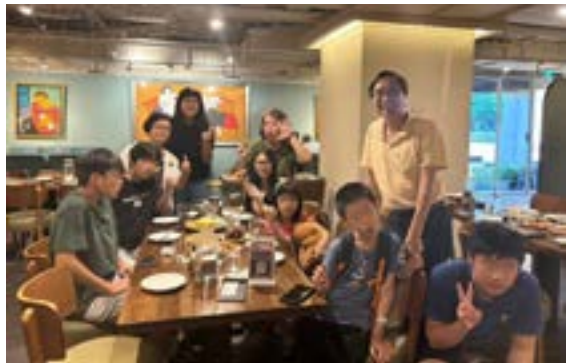
▲作者與天使樹志工、孩童聚餐。

讓我寧被罵、寧可被騙、寧可翻山越嶺，也要把天使樹的禮物及神的愛帶進孩子的生命與他們的家。感謝神，越服事愈感恩，因我看見神興起祂的器皿。