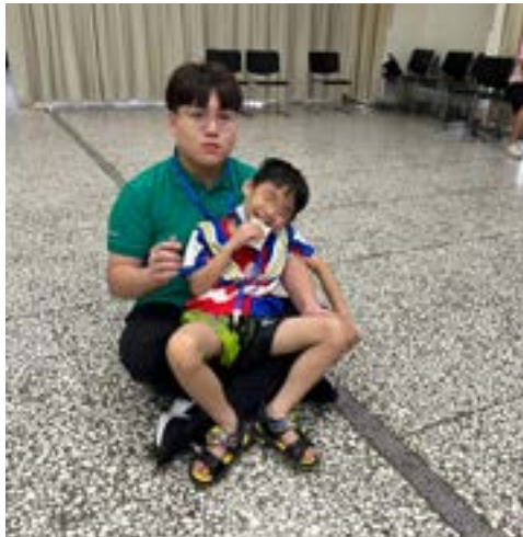
▲張同學與天使樹小孩互動。

很高興能成為天使樹的志工，要繼續將從神來的力量與方向帶給收容人的家庭，尤其是他們未成年的孩子，使他們在神的愛中成長，因著認識耶穌成為他們一生中最美的祝福。