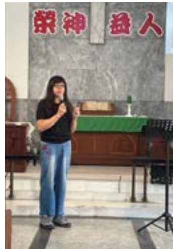
▲作者於志工訓練分享。

今年加入天使樹關懷大隊，在隨機安排下，我所負責長期個案關懷的 4 個家庭 7 個小孩，全是父母缺席的隔代教養，近一半是從未見過爸爸或媽媽的單親家庭。這 7 個孩子，有的是被母親男友長期家暴，社會局介入轉住兒童之家多年，今年轉來和奶奶同住。有的從未曾見過母親，現在和奶奶爸爸同住，但去年出獄的爸爸從 18 歲吸毒到如今 48 歲，反覆進出監所至今，仍深陷毒海。有的母親在監，父親不詳，有的父親在監，母親卻一年只見 2-3 次面。每個小小心靈承受著說不出的