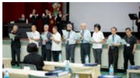
▲更生團契同工、志工獻詩。