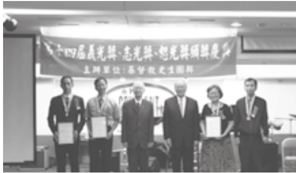
▲ 志光獎四位得獎人

2008 年黃志堅牧師調到寒溪長老教會牧會後，就加入更生團契宜蘭區會的監獄志工，黃牧師主要帶著一群中、高齡的教會姊妹到宜蘭監獄關