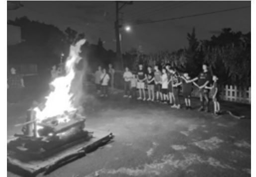
▲ 2022 年 7 月獨輪車營，營火晚會。

有鑑於獨輪車能帶給孩子許多的助益，今年天使樹開辦為期五天的獨輪車營，除了讓天使樹的孩子，透過學習獨輪車，培養天使樹孩子在艱難的環境下，學習「永不放棄」