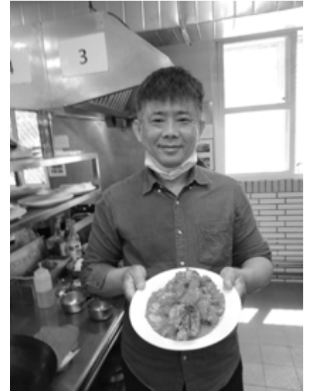
▲作者於中途之家製作菜品。

自 2023 年 3 月開始，我持續嘗試突破，報名參加中餐丙級證照的培訓課程，3 月 11 日這天，體驗了初次的中餐烹煮經驗，從備材、備料到烹煮，獨自完成此道美味佳餚 - 糖醋燴魚片。菜餚完成後，心中只有對主深深的感謝以及感恩，因主的恩典，我才有這個機會在餐飲學校學習、考證照、不斷的成長及接受裝備，也才能有生命接受造就的機會。