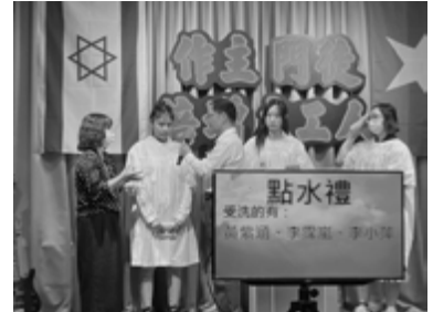
▲ 馨園復活節二名姊妹受洗。

每一個事件發生後會有兩三天的漣漪，接下來的碎言碎語及情緒的平復又得花時間安撫。總之，有三天平靜安穩，就可算是神蹟。有人也許會問，此等工作艱難吃力又不討好，