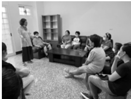
▲ 馨園二家成立牧師祝禱。

容也不為過，其中最艱難的是舊習的戒除及新習的養成。坐無坐相、口爆粗言、動手互毆、偷抽煙、陽奉陰違、滿口謊言…不勝枚舉，也令人頭痛不已。