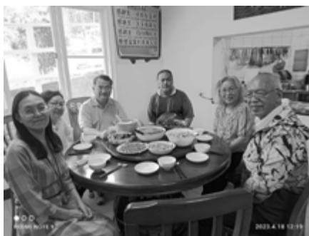
▲ 耕心園接待餐生人。

福音傳進了監獄，更生人信主，立志要走服事的道路，但是初信的他們仍然需要長期的輔導與陪伴，通過不斷的學習與磨練，生命與品格才能漸趨穩定與成熟。耕心園的願景