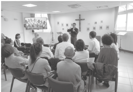
▲作者（中）於感恩禮拜中分享。

當日，周師母及三位弟兄帶領讚美詩歌，頌讚守約施慈愛的天父上帝及祂的恩典，大家唱出獻上自己、全然向主的心志。來自花蓮市東華浸信