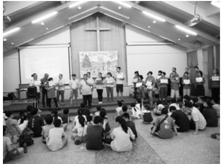
▲ 2020 年天使樹快樂營

第一線接觸天使樹的孩子，母親緊緊拉著孩子的手，訴說當年父親當著孩子及同學的面被警察上銬帶走的困境；母親即將帶著妹妹改嫁，孩子面臨被拋棄的恐懼；父母皆入監，大孩子帶著弟妹過活，滿屋髒亂，桌上堆滿未處理的免洗餐具、牆角都是空的塑膠袋……看著就讓人心疼，孩子心中的痛作爹娘的你知道嗎？