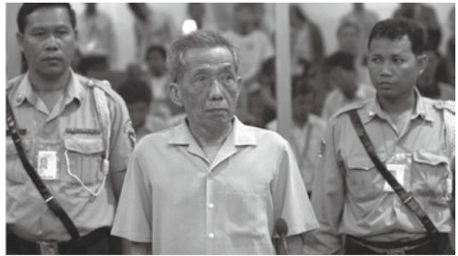
▲康克由(杜赫同志；中)從一名中學老師變成殺人如麻的監獄長，再以階下囚終結一生。

據 指出，在1975至1979年紅色高棉(Khmer Rouge)統治下，大約有200萬無辜生命犧牲。在這獨裁年代的重要人物，原S21集中營、鍾屋殺人場和一個殺戮場的