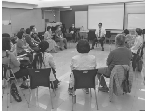
▲ 志工講座 3 於城中長老教會

身為神國的「精兵」或說跟隨主的「門徒」，要有心理準備—必須付上代價，「時間」就是代價的一種。透過晨更，弟兄姊妹們可以彼此了解，彼此扶持，彼此勸勉，彼此相愛。若能持續下去，經年累月的參加，自然就會成為一批精良的團隊，有了團隊，神自然會開路進入水深之處，領更多人歸主。