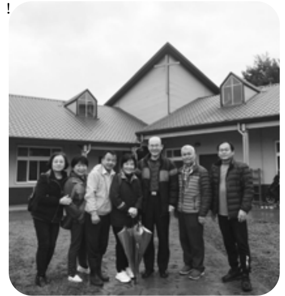
▲作者（右）於宜蘭珍愛家園。

羅馬書 8:28「萬事都互相效力，叫愛神的人得益處。」振傳要感恩、感謝的人實在太多，當初你們的付出、關心、陪伴造就今天的我，讓我行公義、好憐憫、存謙卑的心與神同行。榮耀歸給上帝！