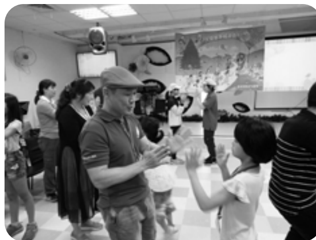
▲作者（中）於幸福派對活動中與孩子互動。

另外一件值得感恩的是，今年投入「天使樹佈道小組初階班」的學員有30位之多，相信是神為今年重新開辦「天使樹幸福派對」所興起的福音精兵，也預告了，神要透過這4場「幸福派對」，帶給這些孩子極大的祝福，天使樹的孩子們，今年一定要幸福喔！