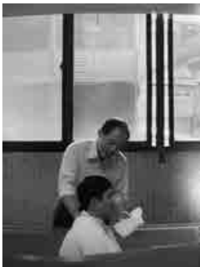
▲ 作者由林棟梁長老於長春禮拜堂施洗

我月初的報備申請，高層也批准，突然在 18 日早上又說不行、不准，整個無名火湧了上來，當火山要爆發時，一個聲音告訴我，先冷靜下來想想吧！說也奇妙，當我離開，聖靈又告訴我，規矩就是規矩，你來這裡不就是要學會順服嗎？12 月 20 日是我去醫院回診的日子，我因為過號所以要往後延等，然而，就在我等待的時候，看見一位奶奶年紀大約七十多歲了吧！她剛好過了她的號碼，才過號一個人，結果，她就亂護士小姐說：我才過一個號碼而已，拜託！讓我看先啦！護士說不行，阿媽就一直魯，護士受不了了，就牽著阿媽的手，帶她看有寫規定的牌子，當下她告訴阿媽說：規定就是規定，不能改變，假如人人都像妳這樣的話，那不就要大亂了嗎？那還要規矩幹嘛！」聽到最後那一句讓我震撼了一下，因為她不是說規定了，而是說規矩，突然，我明白了，神所要告訴我和啟示我的話語，如果為我一個人破壞規定的話，那團契又怎麼管理呢？根