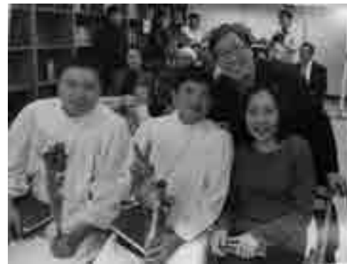
▲ 作者（中）與弟兄受洗前合影

在更生團契中途之家只有我和家賢弟兄，還未受洗，聽受洗的弟兄說：受洗完後後一定會碰到考驗。心中就想