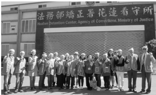
▲同工、志工全體合影

滿 心感謝天父上帝的恩典，自從 2007 年有幸參與更生團契的服事以來，轉眼間竟已過了 14 個寒暑，雖說是無心插柳，我相信這是上帝早已量給我的地界和產業；我再說非常感謝天父上帝的引領與安排，這真是榮幸之至的恩寵，也是創世之前早已備妥的賞賜。