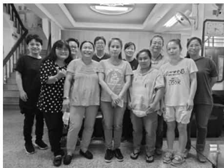
▲作者(後排右2)於台中更生團契