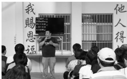
▲作者於更生團契退修會分享

更生團契四十禧年，願上帝祝福滿滿於更生事工，有更多的40年為主擺上；勤做主工，為主在監所內興旺福音，耶和華的名在各地區的事工更得榮耀；受刑人更多的經歷主、遇見主。祝福更生團契四十禧年得神喜悅，為主得人如得魚。