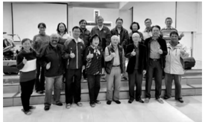
▲ 區會委員、顧問、同工們與王董事長合影

上帝的道是活潑的，是有功效的，比一切兩刃的劍更快，甚至魂與靈，骨節與骨髓，都能刺入、剖開，連心中的思念和主意都能辨明。（來 4：12）