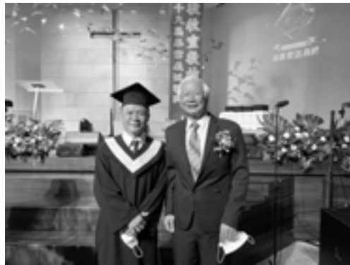
▲ 作者與黃牧師於神學院畢業典禮合影。

在團契實習的這一年中，神常常提醒我，做為一個傳道人，最重要的不是學歷，而是生命。這次畢業典禮，學院特別邀請黃總幹事為畢業生祝禱，他說：傳福音給自己所愛及不喜歡的人同樣重要，因為耶穌給教會的囑託就是「不願有一人沉淪、乃願人人都悔改」（彼後 3:9b），自己過去曾經沉淪，如果不是神的憐憫，不會有今天的我。求神繼續帶領我，在未來的侍奉道路，靠主得勝，領人歸主，期盼我這個「新生」，能為主活出美好的見證。