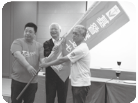
▲ 明年退修會於高雄

這次給苗栗區會的同工們很大的鼓勵，也有很多的學習與提醒，即便是有很多次的營會經驗，上帝卻一再的提醒我，都要用『第一次』的態度，因為這樣會讓我更謹慎。退修會雖喜樂的畫下句點，但沒有停止更生同工志工前進服事的心；「行伍整齊、不生二心、通達時務、知所當行」，團訓的聲音依然迴盪在耳邊。感謝主，苗栗區會這次舉辦全國同工志工退修會，老實說，真的很累，因為有很多繁雜的工作，但是，看到大家參與在其中，彼此互相的鼓勵與代禱，我相信這是上帝自己成就的，我們在其中歡喜快樂。退修會結束了，但是我們的禱告不能結束，各區會所提出的代禱事項，我們繼續用禱告彼此紀念，相信明年的退修會能聽到更多的好消息。