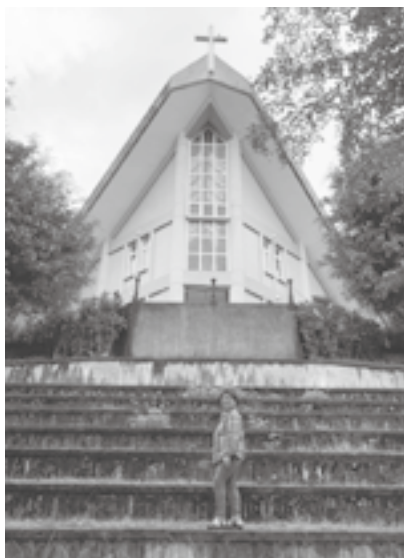
▲ 筆者於學園一恩堂留影

在這四年的陪伴過程當中，與孩子們一起走過高山繞過低谷，有歡笑也有悲傷，我用愛陪伴並以愛期待著。每個早晨都帶著新來園及留園的孩子們一起晨更，盼望能藉著神的話語把他們引導到神面前。當看見孩子們的行為改變，功課進步，他們高興，我也開心，為他們感謝主。一個高二的孩子，在校與同學發生衝突，午休時間私自離開學校，跑到光復火車站買了一張到台東的車票，當他拿著這張車票時，他猶疑了，心裡問著，「哪裡是我的家？是台東？還是少年學園？」他向神禱告，求一個印證，如果我打電話給學園的一位老師，在 13：10 以前他能接到我的電話，我就回學園。結果上帝垂聽了他的禱告，他退了車票跟老師回到學園。回到學園孩子看到