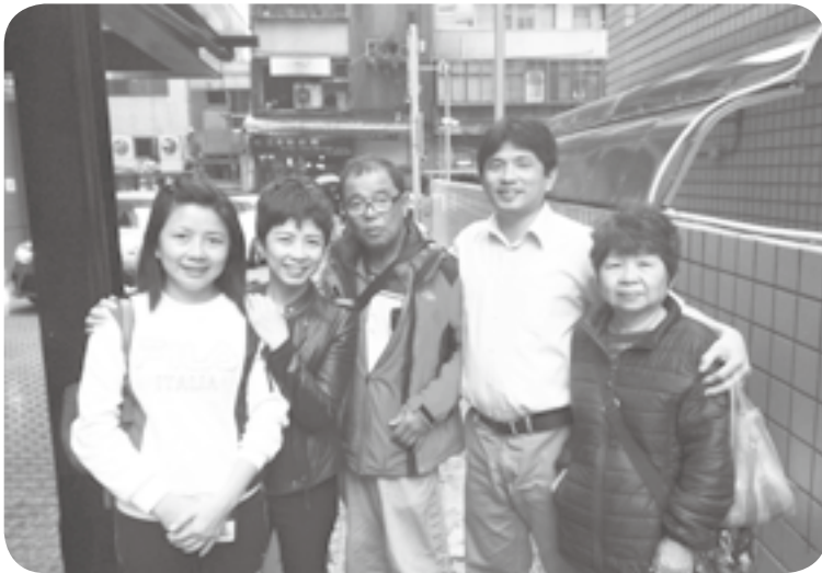
▲ 筆者（右二）與家人合影

親愛的主耶穌：「感謝讚美祢，謝謝祢常用人、事、物來教導孩子，讓孩子發現自己的不足和需要改進的地方。請主繼續的修剪孩子，使孩子成為祢所喜悅的人。也謝謝主，幫孩子修補和家人的關係和距離，並讓他們看見我的改變。孩子也求祢看顧、保守、台南戒毒村的弟兄們，使他們都能正視自己的軟弱，出監後，不再受毒品的轄制，求主眷顧，阿們！」