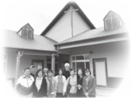
▲ 宜蘭珍愛家園（筆者前排左二）

我既然相信福音救我脫離死亡，使我成為新人，這個新人就應該如約翰福音第四章那個撒瑪利亞婦人一樣，將自己過去的的事從隱藏變為宣揚，來見證耶穌是救主，拯救像她曾經是活在過犯罪惡之人。求