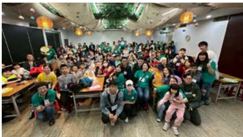
▲ 4月3日於準休閒農場全體合影。

感謝上帝，活動一開始雖下大雨，變數很大，我們都要同心合一禱告，相信神、倚靠神，祂會帶我們打一場勝戰。很開心能與弟兄姊妹同工，一起傳福音，贏得靈魂。