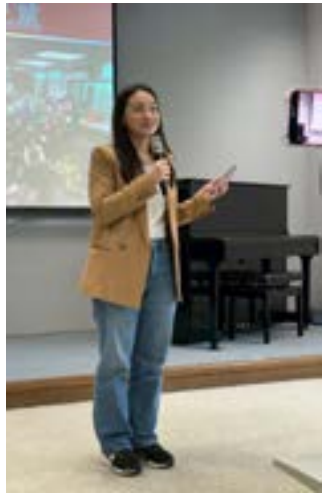
▲作者於天使樹關懷大隊培訓班見證分享。

少有接觸兒童的經驗，但這些課程幫助我實際預備自己，更有信心成為孩子的祝福。透過《天國護照》、繪本與說故事的訓練，學習用孩子能理解的方式傳遞福音；加上 21 天靈修筆記，也再次提醒我——上帝何等看重孩子，並呼召我們將真理帶給他們。