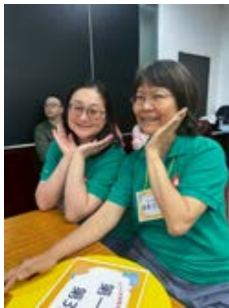
▲作者（左）於天使樹活動合影。

經費的挹注，活動能在自然舒適的環境舉行。看著孩子們在草地上追逐泡泡、放鬆身心，並透過認識昆蟲習性學習守護生命，我深刻體會到資源被善用的意義。雖然「認識耶穌」的環節因場地限制讓孩子稍顯分心，但同工生動的故事引導依然非常吸引人。