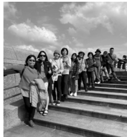
▲第八屆佈道小組初階畢業旅行金山。

感謝神，仍有教會不屈不撓的跟進且有美好的果效，2011年起我們先收集並報導這些教會「如何有效跟進天使樹孩子與家庭的方法與步驟」，刊登於更生雜誌上，提供給有需要的教會