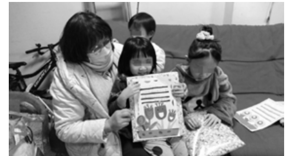
▲平溪靈糧堂探訪天使樹家庭。

一位母親犯了錯，就抹煞了她對自己孩子的愛嗎？雖然她犯了錯，但難道她就不會是一個愛孩子的媽媽嗎？耶和華神創造人時，