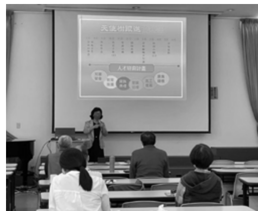
▲作者於志工特殊訓練中分享。

更生團契舉辦「天使樹活動」，在台已經有26年，每年受惠的天使樹孩子平均有三千多人，為長期栽培這些孩