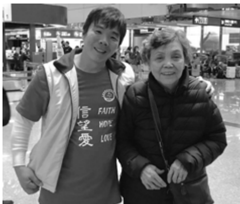
▲作者於母親生日時合影。

在遇到服事的瓶頸時，感謝主用這對夫妻所做的和黃牧師在年終評量表上所給的勉勵，讓我知道在難行之處，要用什麼心來走這第二里路。