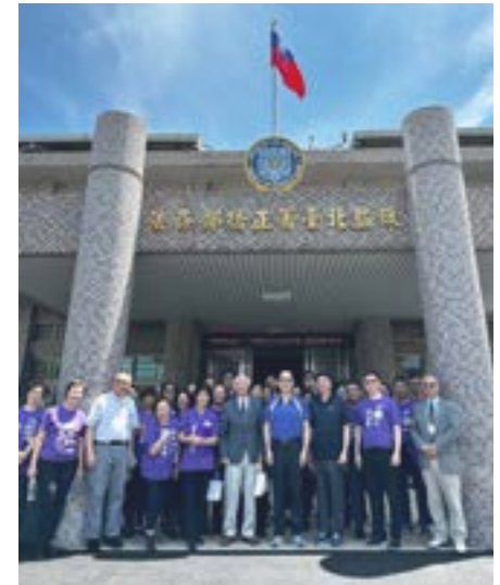
▲作者（左三）與羅蘭崗短宣隊於北監合影。

另一件是我在更生團契發現了一個新名詞“徵信”，是在北美的“隱私保護”風氣下從沒聽過的。這個把奉獻團體和個人的名字和奉獻金額按月逐條公佈的公開檔反映出了財務管理的透明度和遵守法律的嚴謹性。