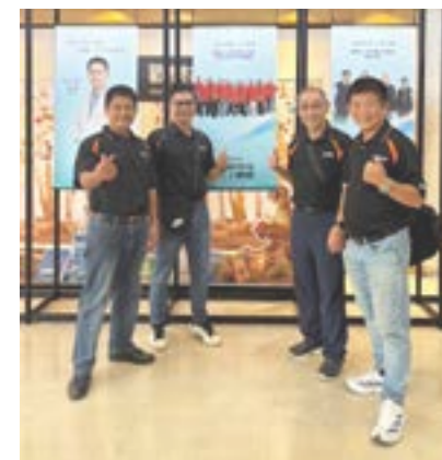
▲作者（右後）與永新弟兄合影。

回溯至 2017 年 11 月，我受差派至台南明德戒治分監（素有「天下第一村」之稱）擔任駐監傳道。當時，我心中一直有個清晰的異象——成立中途之家。