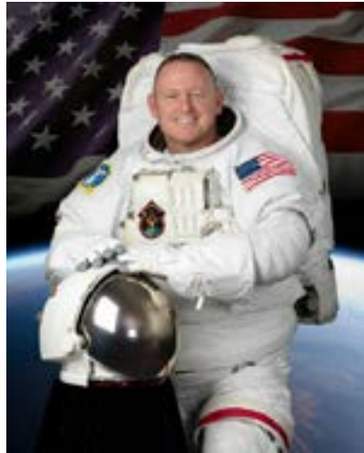
▲美國太空人威爾莫認為，即使身處困難環境，仍有上帝的美意存在。

威爾莫是德州普羅維登斯浸信會會友，在受困太空期間仍持續與教會保持聯繫，甚至多次從太空站打電話給教會內的長輩，鼓勵他們放心。