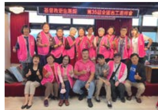
▲作者（右下）與基隆區會同工志工合影。

在監所事工的路上，我們深知挑戰重重，但更知道，當我們願意回應主的呼召、順服祂的帶領，祂必要為我們開路。願我