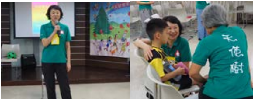
▲作者於天使樹活動中分享、與天使樹小孩互動。