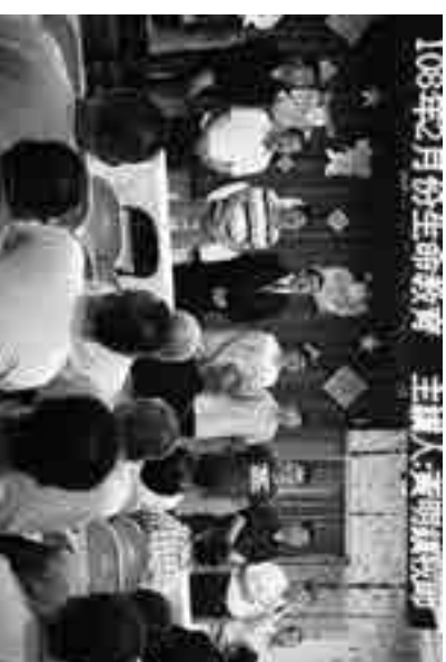
▲更生弟兄於明德戒治分監唱詩讚美神