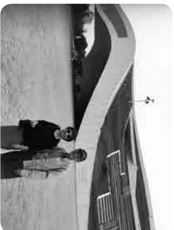
▲ 靠主得勝以豐盛生命南下傳福音，攝於衛武營國家藝文中心