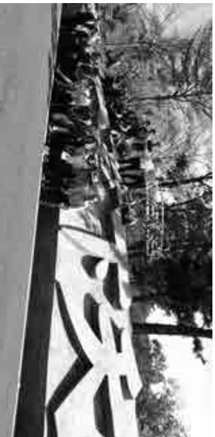
▲筆者於明德戒治分監與弟兄姊妹一同合影

能在這麼好的環境裡，接受那麼好的人性化管理，以及接受來自主耶穌的慈愛恩典造就，相信戒毒村裡的同學們，一定會越來越相信唯有倚靠主耶穌，才能徹底改變我們的生命，未來也必定會有更多的人，在領受到福音後而歸入基督裡的，阿們！