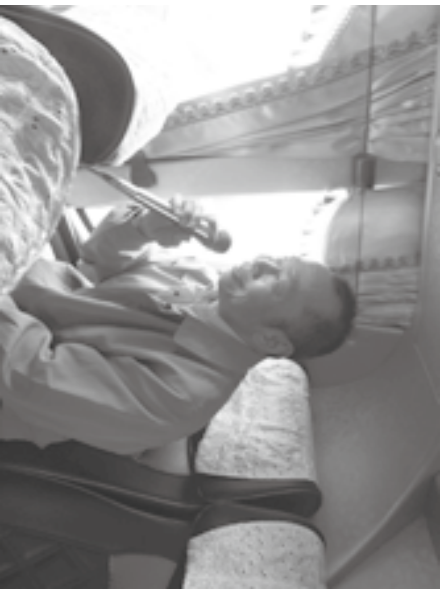
▲筆者於遊覽車上分享見證

從我少年開始，我除了因使用毒品被判刑，進監獄服刑之外，我在當兵時也因攜械逃亡入監過；我還曾因犯過強盜罪、傷害罪、竊盜罪及偽造文書罪入過監。在沒來到更生團契以前，老實說，打死我都不會相信，會有這麼一天，我不