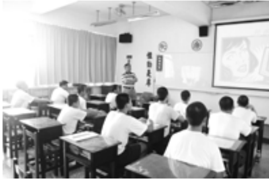
▲作者於少年觀護所授課。

至於個別輔導方面，我選擇談話的對象，通常是依據少年在行動學習單表達談話意願，或是其他任課老師轉介的個案。其