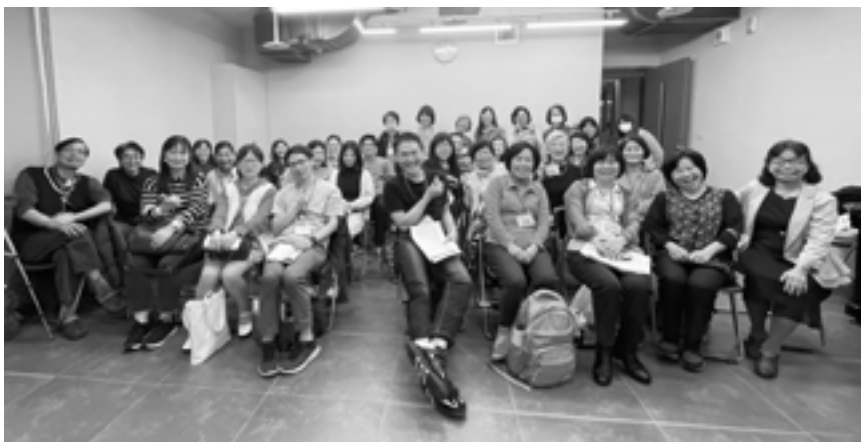
▲作者(右)與第九屆天使樹佈道小組初階培訓全員合影。

聚集歷屆佈道小組的得勝者，我們開辦「佈道小組導師課程」，訓練一群「老師的老師」，目前邊學習、邊示範與指導；就是初階學員口中所分享無怨無悔的陪伴、指導、提供資源…的學長姊們，這群精兵將於六月完訓，期待藉著課程學習與實際操練，明年可增添一群生力軍，請代禱。