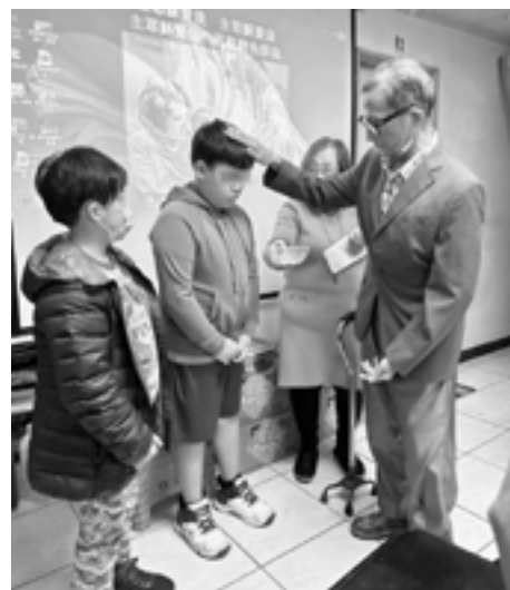
▲作者（右一）為天使樹兒童施洗後禱告。

教會每週也安排讀經進度，牧師與師母將選出經文重點，示範禱告帶進祝福，讓他們得著啟示，對生命大有幫助！另外，就是 RPG 禱告，包括天使樹青少年；求主聖靈充滿他們，不斷恩膏他們靈魂；防止在手機玩物喪志妨害他們的學習，並鼓勵他們多多閱讀，及傾聽老師教導，促進功課進步、避免世界各樣威逼利誘，防避邪教誤導及戕害身心健康成長蜚語流言。教會製作「主禱文」卡，讓孩子方便每日誦讀，總是要用百般的智慧來傳耶穌基督的福音。