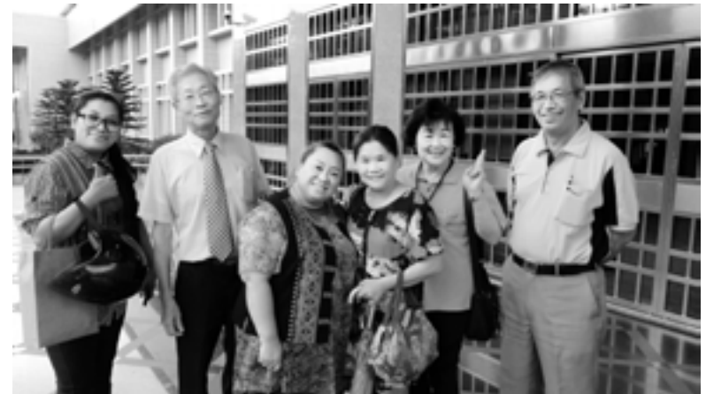
▲作者（右）與區會團隊監外合影。

我常覺得如果我們能在他們年少時，就給予正確的價值觀與基督的信仰，就可以減少成人監所的人滿為患，而他們也能從非行少年蛻變成飛行少年。我之所以要分享我在少所的服事經歷與感受，除了感恩上帝讓我在少所學習關懷非行少年外，我更期待有更多基督徒加入少所服事的行列，讓少年的人生不再慘綠，而是成為上帝兒女的繽紛人生。