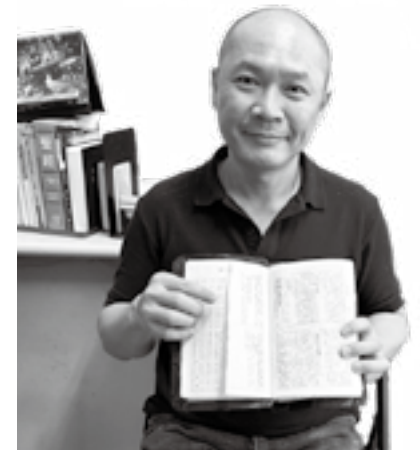
▲作者展示當時被撕的聖經。