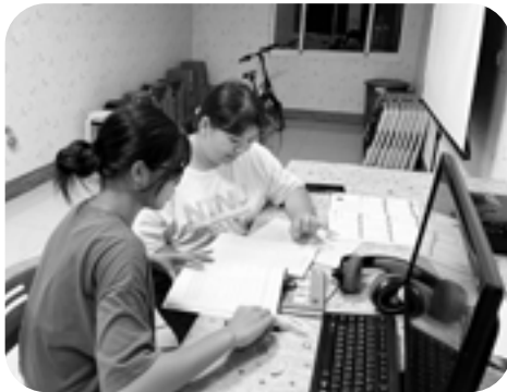
▲ 姊姊輔導作者（下）功課。