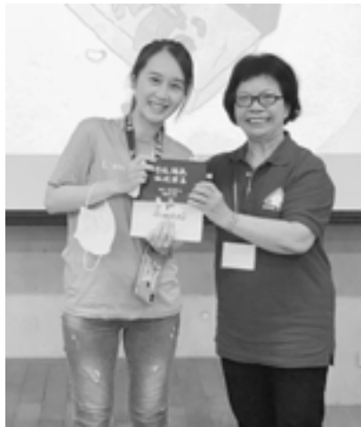
▲作者（左）與天使樹僕傳道合影。

神就是愛，願這福音能繼續廣傳到各處，照亮黑暗的角落，使許多凋零的生命因著基督的救恩，走出死蔭幽谷重新綻放更璀璨美好的遠景。