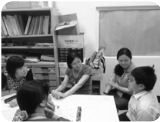
▲作者（左）與孩子初次見面，目前孩子就讀大學。

「所以，我親愛的弟兄們，你們務要堅固，不可動搖，常常竭力多做主工，因為你們知道，你們在主裏的勞苦不是徒然的。」（林前 15:58）