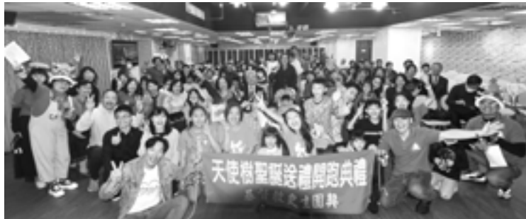
▲天使樹開跑典禮合照。

喜孜孜的扛著大禮物，心中真是感謝神，給我們有機會陪伴，求神加倍恩待祝福這些孩子。