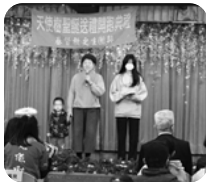
▲ 作者（右）於天使樹開跑分享見證。